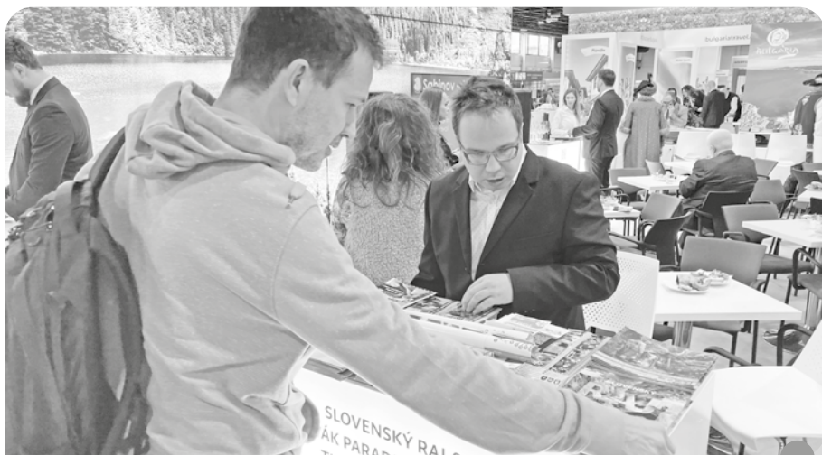
Naše mesto a región sa každoročne prezentuje na výstavách a veľtrhoch cestovného ruchu v spolupráci s OOCR Slovenský raj & Spiš a s KOCR Košice Región Turizmus. Nebolo tomu inak ani tento rok – vo februári sme sa zúčastnili výstavy Utazás v Budapešti, v marci na Holiday World v Prahe a na Caravan Bike Travel v Nitre, v apríli na ITF SlovakiaTour v Bratislave a v máji na rodinnom festivale Kroky v Košiciach.