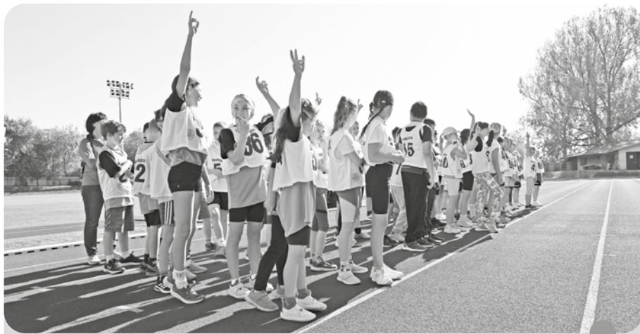
Mladí športovci z tunajších základných škôl 30. apríla súťažili na atletickom štadióne Tatran v atletických disciplínach - v rámci Mestskej športovej olympiády .