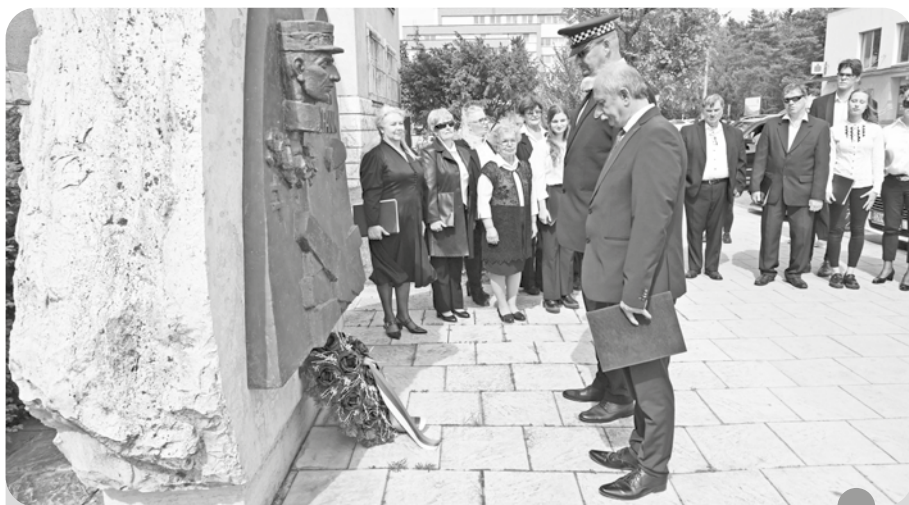
Okrúhle 105. výročie úmrtia M. R. Štefánika sme si pripomenuli 3. mája pri jeho pamätníku pred tunajším mestským úradom.