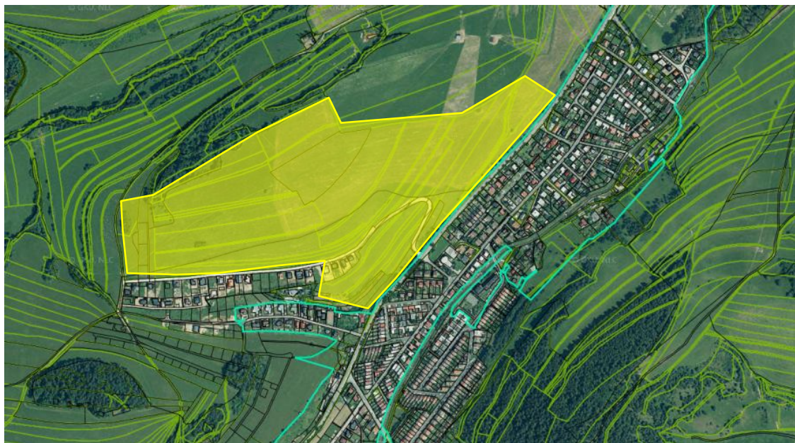
Príloha č. 1 – A - Vymedzenie riešeného územia, ortofotomapa