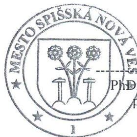
PhDr. Ján Volný, PhD. primátor mesta

Schvaľujem vyhodnotenie obchodnej verejnej súťaže na podávanie a výber najvhodnejšieho návrhu kúpnej zmluvy na odkúpenie nehnuteľného majetku mesta Spišská Nová Ves nachádzajúceho sa v k. ú. Spišská Nová Ves, a to pozemku par. č. KN-C 8496/3 (TTP) o výmere 272 m 2 , ako geometrickým plánom č. 68/2013 vyhotoveným dňa 15. 8. 2013 novovytvorenú parcelu z parcely KN-E 55962/1 zapísanej v LV 4342.