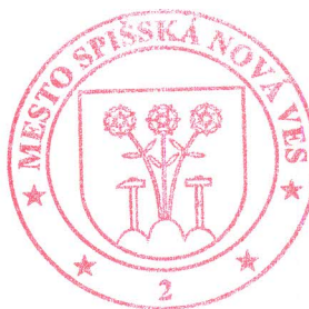
PhDr. Ján Volný, PhD. primátor mesta

Druh akcií: kmeňové akcie ISIN: SK 1110001635 Forma akcií: na meno Podoba akcií: zaknihované Menovitá hodnota akcií: 3 319,39 € Počet akcií: 420 Podiel emisie: 46,666 %